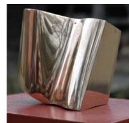
poliert (4800 €)

In der EDITION biete ich Ihnen die besonders interessante Variante der Finanzierung in 24 Monatsraten. Bitte teilen Sie mir Ihr Interesse bis zum 1. Oktober 2009 mit, damit ich planen kann. Für weitere Informationen stehe ich Ihnen gerne zur Verfügung.