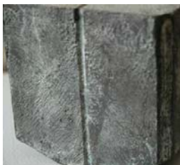
Patiniert (1500 €)