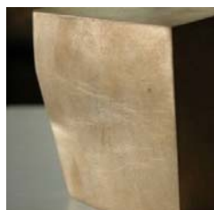
geschliffen (2400 €)